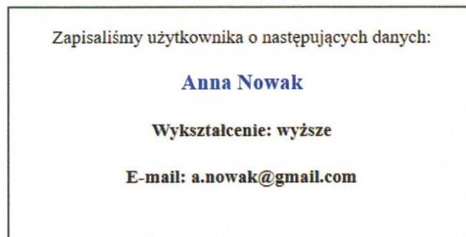
Rys. 50.4. Efekt skryptu z przykładu 50.2

Po wprowadzeniu danych do formularza otrzymamy komunikat o następującej treści: